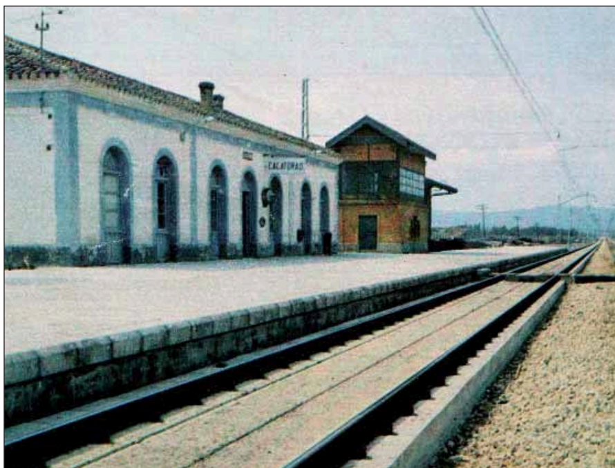
Primeros cuatro kilómetros de vía en placa en Calatorao.

sola vez"- de 5.000 pesetas a todos los agentes comprendidos en "la escala salarial reglamentaria".