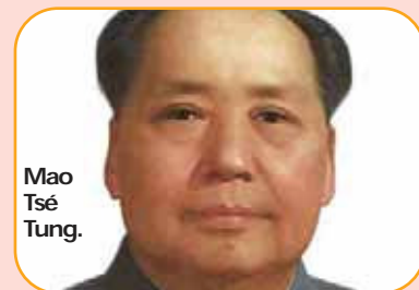
Mao Tsé Tung.

El nacimiento del diario El País y del primer periódico publicado en catalán, Avui , son algunos símbolos del cambio de rumbo.