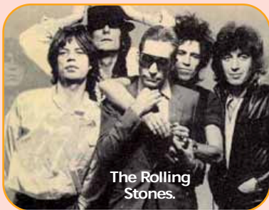
The Rolling Stones.

man ese año su nueva constitución como consecuencia de la Revolución de los Claveles. También los movimientos espasmódicos de Mike Jagger tenían una lectura distinta. Los Rolling Stones, libres hasta la insolencia, tocaron por primera vez en Barcelona. Era un conjunto controvertido, rodeado de un aura sórdida y atrayente que les hacía míticos ya en el 76.