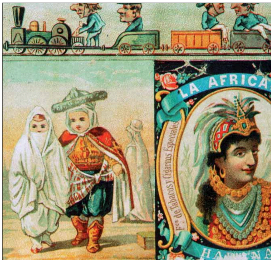
Cuba celebraba el 150 aniversario de su primer ferrocarril.

Finalizando el año, Blanca Fernández Ochoa , esquiadora española, consigue el segundo puesto en la Copa del Mundo que se celebra en Loeche les Bains.