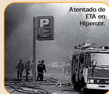
Atentado de ETA en Hipercoor.

El horror se apodera del centro comercial Hipercoor de Barcelona al estallar un coche bomba aparcado en el sótano del complejo. Mueren 21 personas y por primera vez la banda terrorista ETA deja constancia de que la población civil de forma indiscriminada está también entre sus objetivos.